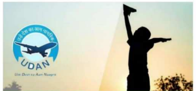
Modified UDAN scheme (Rs 28,840 Cr)