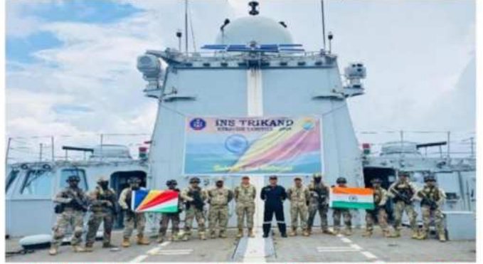
ಲಾಮಿಟಿಯೆ ಸಮರಾಭ್ಯಾಸ 2026 ರಲ್ಲಿ ಭಾಗವಹಿಸುವಿಕೆ

ರಕ್ಷಣಾ ಸಂಬಂಧಗಳನ್ನು ಬಲಪಡಿಸಲು ಭಾರತದ ನಿರಂತರ ಪ್ರಯತ್ನಗಳ ಭಾಗವಾಗಿ ಈ ಭೇಟಿ ನಡೆಯಿತು.