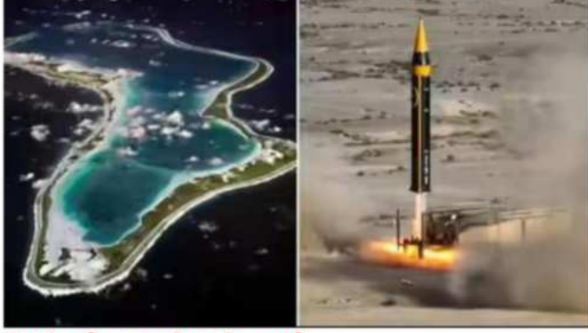
ಡಿಯಾಗೋ ಗಾರ್ಸಿಯಾ ಬಗ್ಗೆ