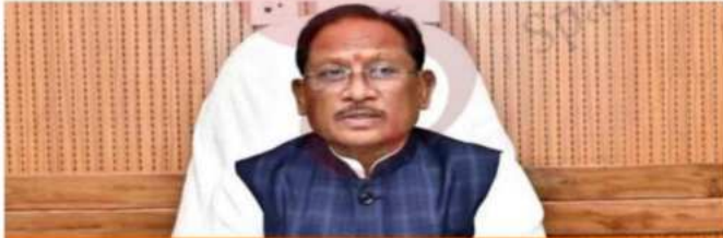
Chhattisgarh Cabinet approves Freedom of Religion Bill, 2026 to curb religious conversions.