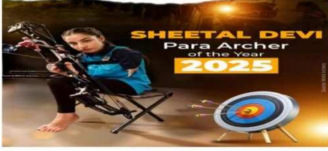
Sheetal Devi named 'Para Archer of the Year' by World Archery